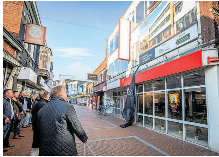
Start herinrichting Langestraat Winschoten.